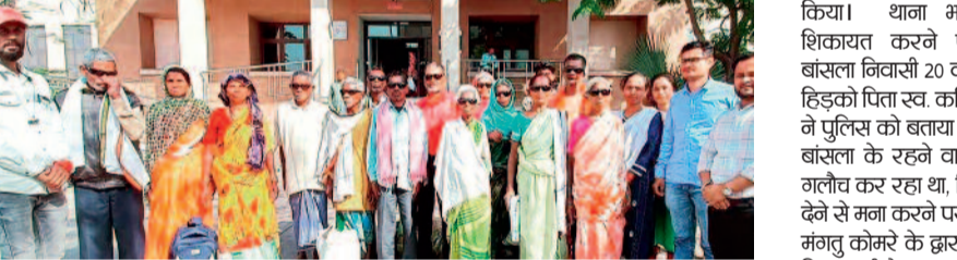
हरिभूमि न्यूज ▶▶ कांकेर