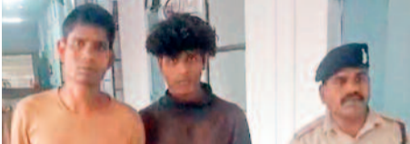
नकदी व सामग्री जब्त